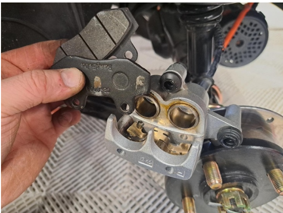
Ota jarrupalat pois jarrusatulasta.