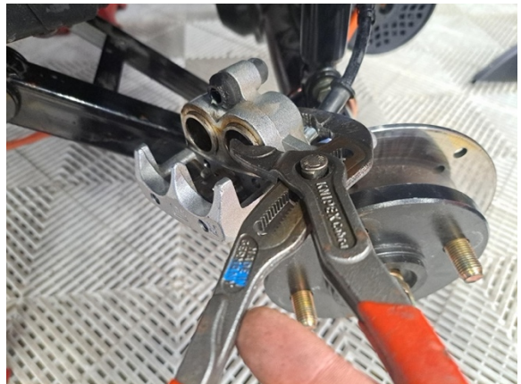
Paina jarrumännät sisään ennen uusien palojen asennusta. (pihdit).

Uuden osan asennus käänteisessä järjestyksessä.