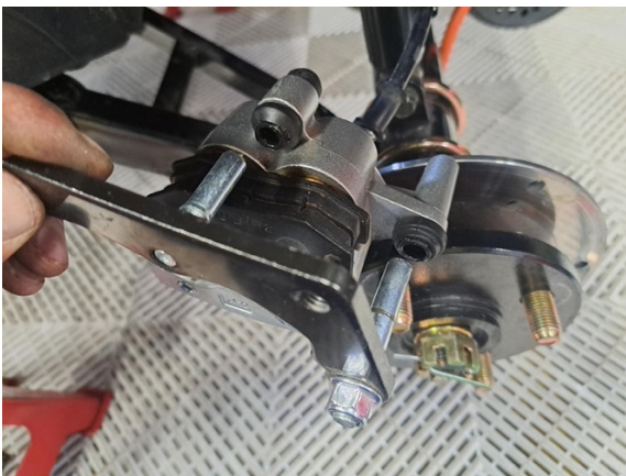
Irrota takajarrusatulan kiinnike takajarrusatulasta.