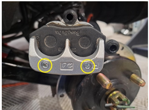
Irrota jarrupaloja takajarrusatulassa kiinni pitävät kiinnitystapit. (kuusiokoloavain 4 mm)