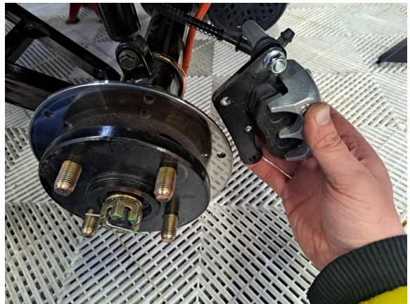
Ota takajarrusatula pois.